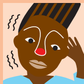
Outros sintomas semelhantes aos da gripe

1 Se está a tomar medicamentos, faça-o de acordo com a receita médica. Tente ter medicamentos suficientes para pelo menos 30 dias e contacte o seu médico ou profissional de saúde, se precisar de uma recarga.