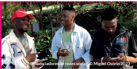
Influenciadores de redes sociais

POR MIGUEL OSORIO, COORDENADOR DO PROGRAMA READY FOR AN AIDS FREE FUTURE (PRONTO PARA UM FUTURO LIVRE DO SIDA) - MOCAMBIQUE