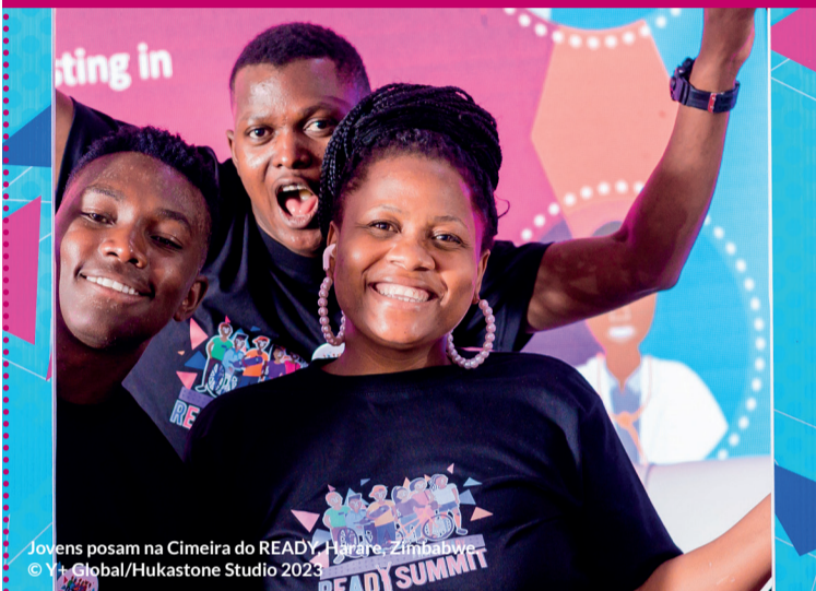
Jovens posam na Cimeira do READY, Harare, Zimbabué.